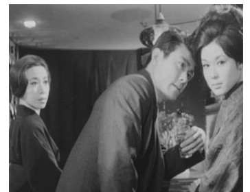
1964 LE MARI ÉTAIT LÀ (Otto ga mita Onna no kobakoyori) de Y. Masumura avec A. Wakao