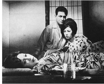
1968 LE MOMENT DU DOUTE (Fushin no toki) de Tadashi Imai avec Jiro Tamiya, Ayako Wakao