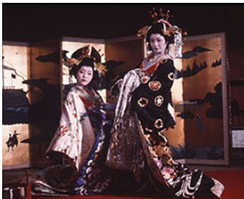
1977 UTAMARO (Utamaro: Yume to shiriseba) d'Akio Jissoji avec Tokuko Watanabe