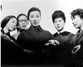
1961 DIX FEMMES EN NOIR (Kuroi junin no onna) de Kon Ichikawa avec Fujiko Yamamoto