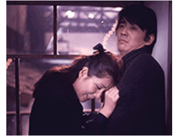
1970 LA GUERRE DES HOMMES (Senso to Nigen) de Satsuo Yamamoto avec Osamu Takizama