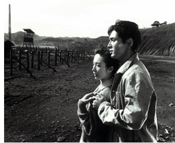
1961 LA PRIÈRE DU SOLDAT (Kanketsu-hen...) de Masaki Kobayashi avec Tatsuya Nakadai