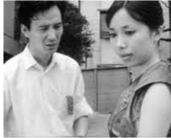
1960 ADIEU LES PISTOLETS (Minagoroshi no uta-yori) d'Eizo Sugawa avec Tetsuro Tanba