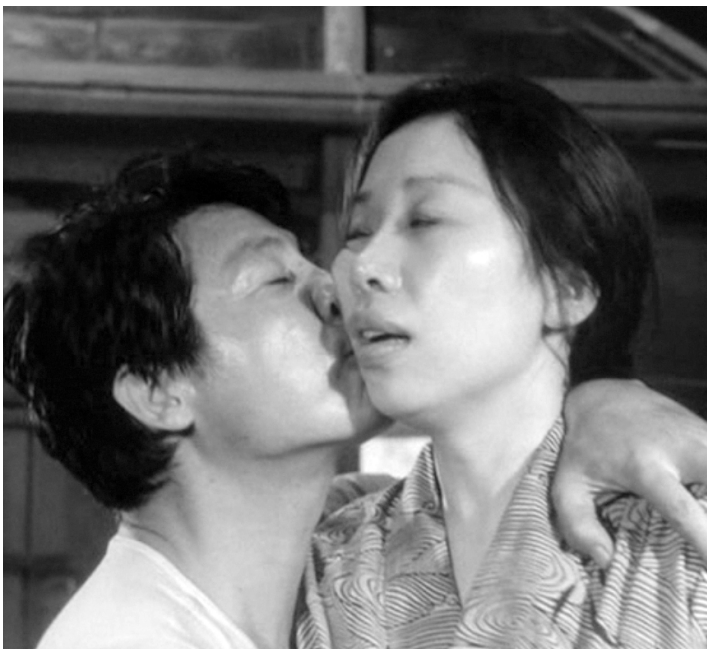
1964 LA FEMME DES SABLES (Suna no onna) d'Hiroshi Teshigahara avec Eiji Okada