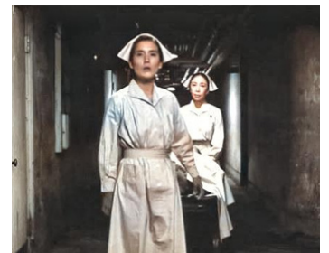
1986 LA MER ET LE POISON (Umi to Dokuyaku) de Kei Kumai avec Toshie Negishi