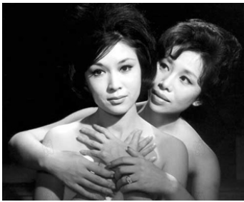
1964 PASSION (Manji) de Yasuzo Masumura avec Ayako Wakao