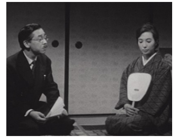
1960 HISTOIRE SINGULIÈRE À L'EST DU FLEUVE (Bokuto kitan) de Shiro Toyoda