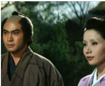
1971 UNE FEMME NOMMÉE EN (En toiu onna) de Tadashi Imai avec Shinjiro Ebara