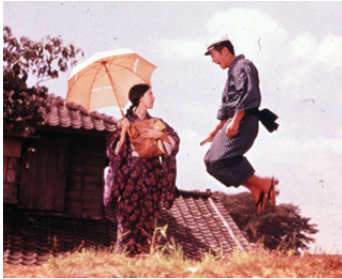
1960 TENDRE ET FOLLE ADOLESCENCE (Ototo) de Kon Ichikawa avec H. Kawaguchi