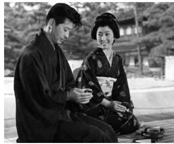
1959 PÈLERINAGE NOCTURNE (Anyu Koro) de Shiro Toyoda avec Ryo Ikebe