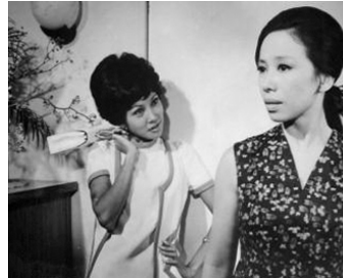
1969 CORPS FÉMININS (Jotai) de Yasuro Masumura avec Ruriko Asaoka