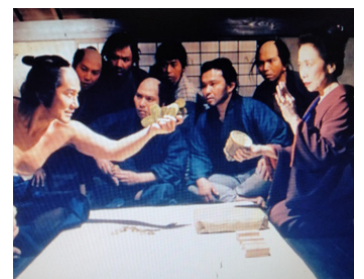
2000 DORA HEITA (Doraheita) de Kon Ichikawa avec Koji Yakusho