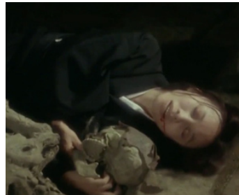
1979 L'ENFER (Jigoku) de Tatsumi Kumashiro