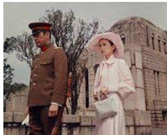
1971 LA GUERRE DES HOMMES 2 (Senso to ningen 2) de Satsuo Yamamoto avec R. Mikuni