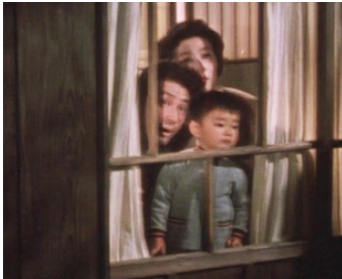
1962 LE SERMENT ROMPŪ (Hakai) de Kon Ichikawa avec Raizo Ichikawa