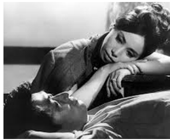
1965 L'ÉCOLE DE LA CHAIR (Nikutai no gakko) de Ryo Kinoshita avec Tsutomu Yamazaki