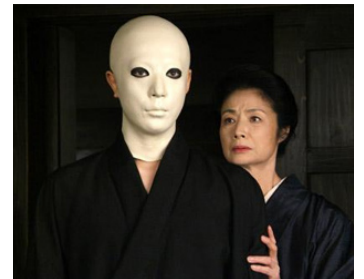
1976 LE COMLOT DE LA FAMILLE INUGAMI ((Inugami-ke no ichizoku) de Kon Ichikawa