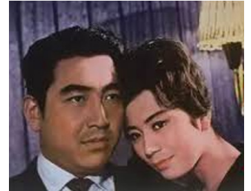
1962 FLEUR ROUGE DU PORT BRUMEUX de Shinji Murayama avec Koji Tsuruta