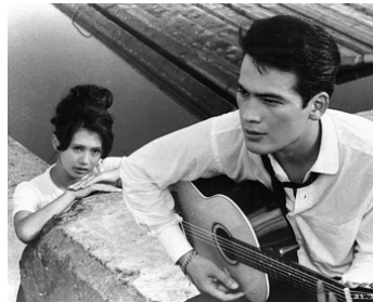
1962 LES LARMES SUR LA CRINIÈRE DU LION de Masahiro Shinoda avec Takashi Fujiki