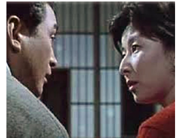
1962 J'AI DEUX ANS (Watashi wa nisai) de Kon Ichikawa avec Mantaro Ushio