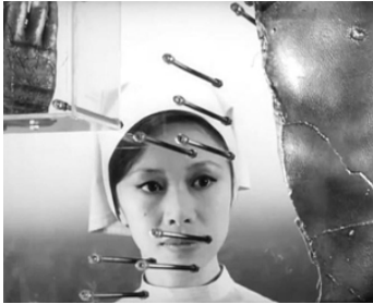
1966 LE VISAGE D'UN AUTRE (Tanin no kao) d'Hiroshi Teshigahara