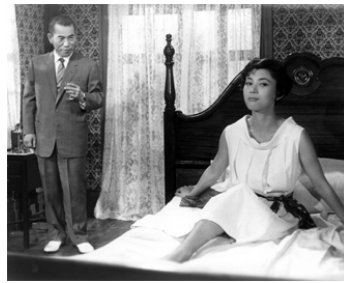
1958 LA SAISON DES MAUVAISES FEMMES (Akujo no kisetsu) de M. Shibuya avec Isuzu Yamada