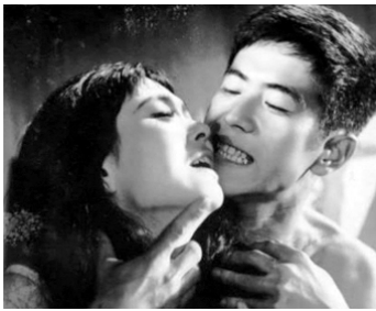
1958 UN HOMME AUDACIEUX (Futeki na otoko) de Yasuzo Masumura avec Hiroshi Kawagushi