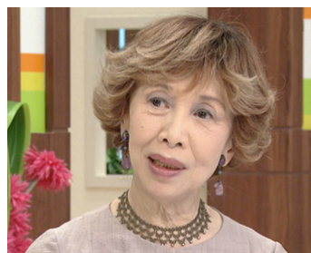
1997 AIMER (Aisuru) de Kei Kumai