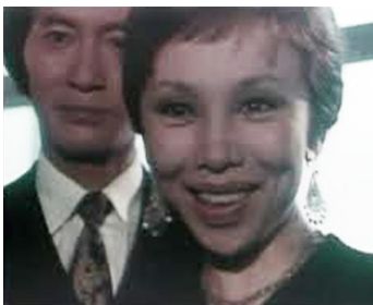
1983 HISTOIRE POLICIÈRE (Tantei monogatari) de Kichitaro Negishi avec Yusaku Matsuda