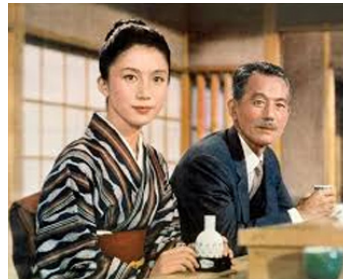
1962 LE GOÛT DU SAKÉ (Sanna no aji) de Yasujiro Ozu avec Chishu Ryu