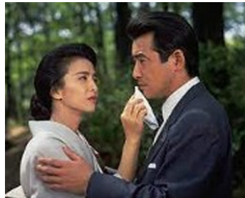
1978 INUBUE (Inubue) de Sadao Nakajima avec Bunta Sugawara