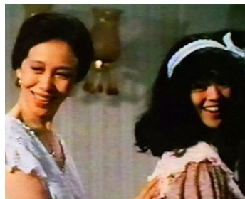
1984 ÉTUDIANTS ! (Seito shokun !) de Katsumi Nishikawa avec Kyoko Koizumi